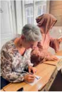
Ausflug ins Bibelzentrum Schleswig