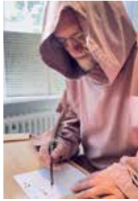
Familiengottesdienst am Suppensonntag

Dieses Bild ist leider nicht für die online-Version freigegeben.