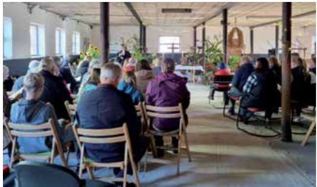
Viele Gäste kamen, um Erntedank zu feiern